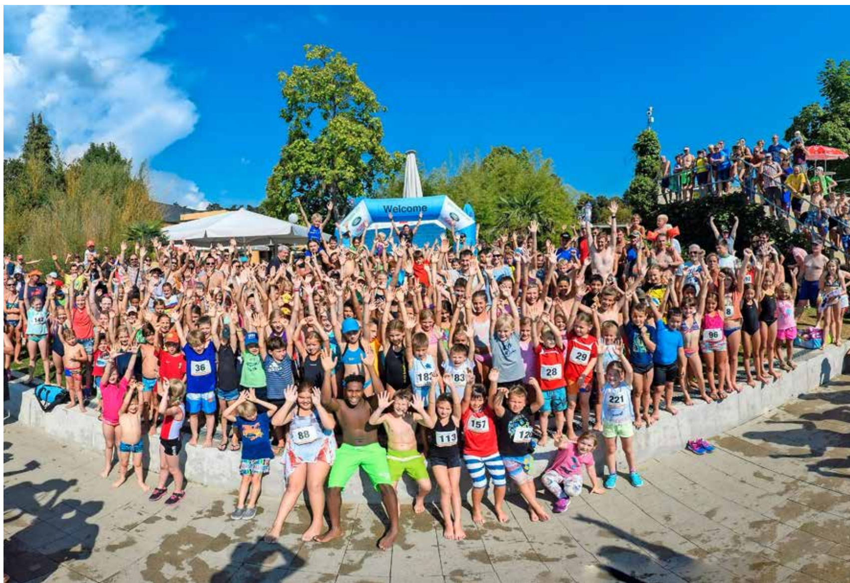
Jubeln mit Olympiasiegerin Nicola Spirig (oben Mitte): die Mädchen und Knaben der Jahrgänge 2003 bis 2010 beim Power-Kids-Triathlon.